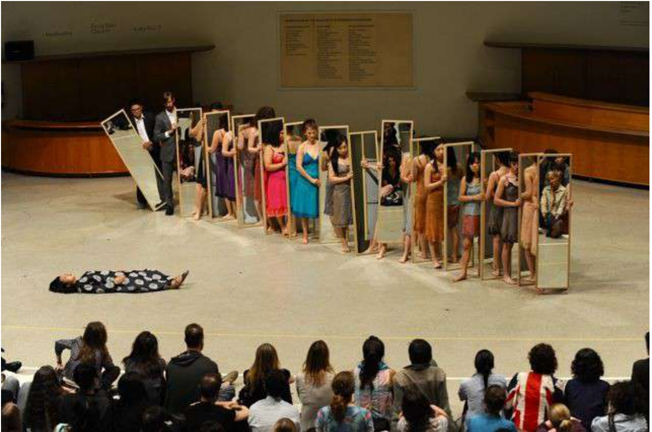
Joan Jonas / biennale de Venise / 2015