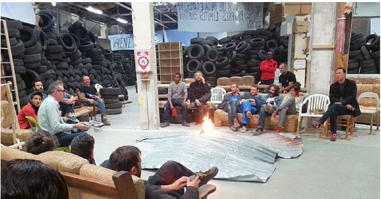
Thomas Hirschorn / Monument philosophie

https://www.youtube.com/watch?v=aerilr8_2Ag